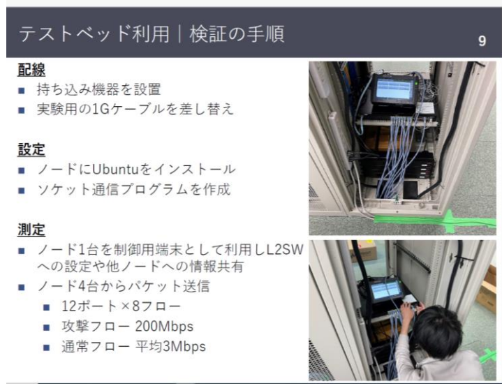
▲StarBEDに実機をもちこんで作業