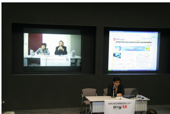
ディスカッションセミナー