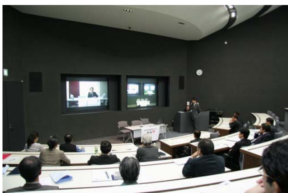
総務省 翁長課長補佐 あいさつ