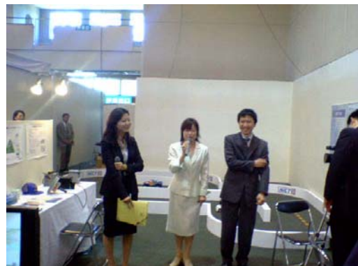
IPコントロールカー日韓対抗レース (通訳・司会者・出場者)