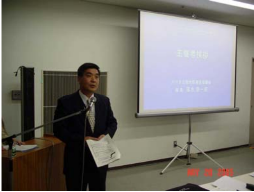
主催者挨拶(落水座長)