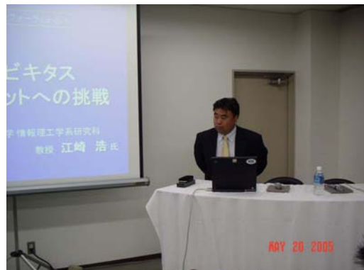
特別講演(江崎大手RC長)