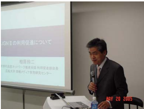
特別講演(利用促進部会長)