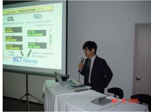
講演(NiCT石塚マネージャー)