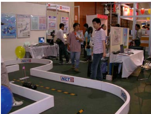
IPコントロールカーデモ展示