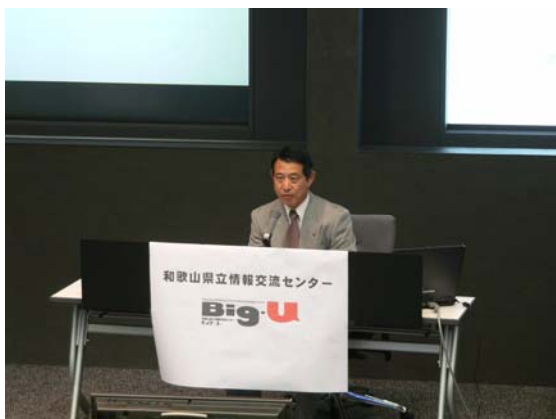
和歌山県 上出IT推進局長 あいさつ