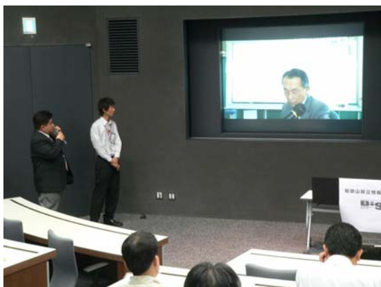
ディスカッション