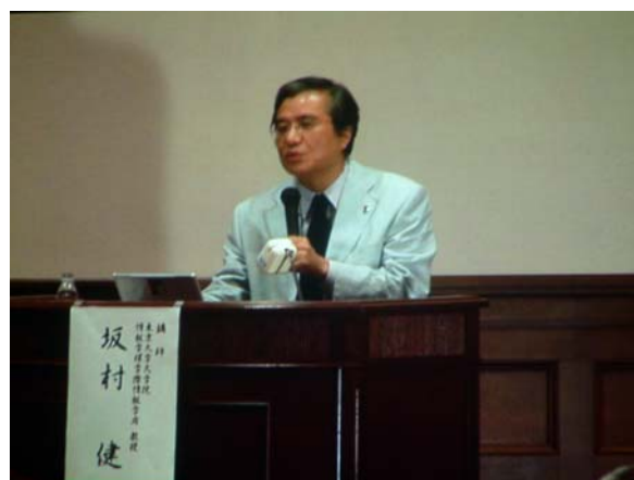
山形県会場での受信映像

他府県会場：他府県会場の担当者からの連絡によると、ハイビジョン映像に初めてふれる視聴者もあり、その精細な映像に驚いていた。講演の内容も評判であった。