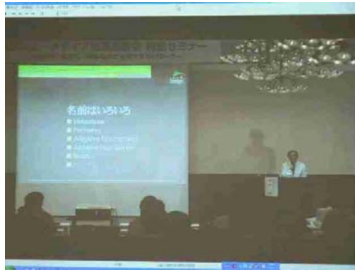
和歌山県会場での受信映像