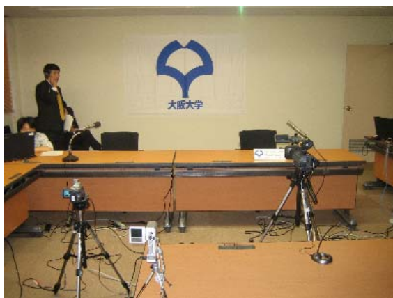
デモ準備の模様 1 (大阪大学 CMC)