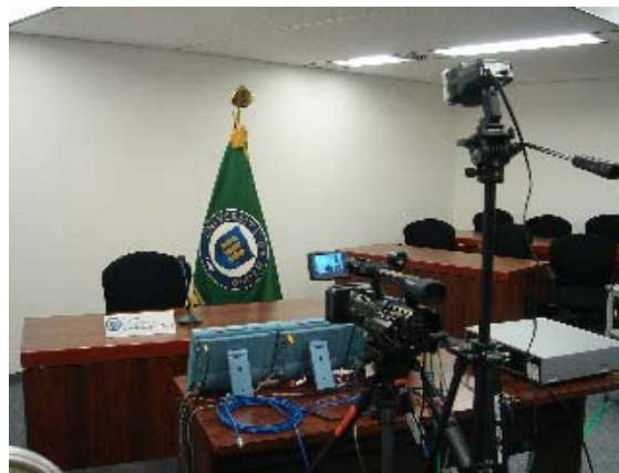
デモ準備の模様 2 (兵庫県立大学)