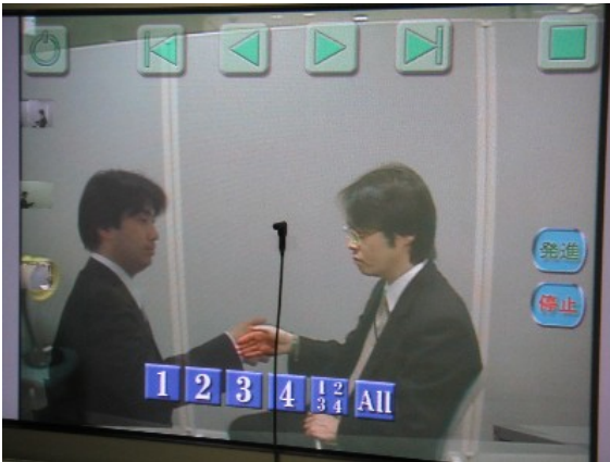
遠隔講義デモの画面(客観視点時) (左ユーザ:つくば、右ユーザ:北九州)