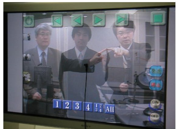
接続時の画面(画面中の3人は各々異なる地点) (左:北九州2、中央:つくば、右:北九州1)