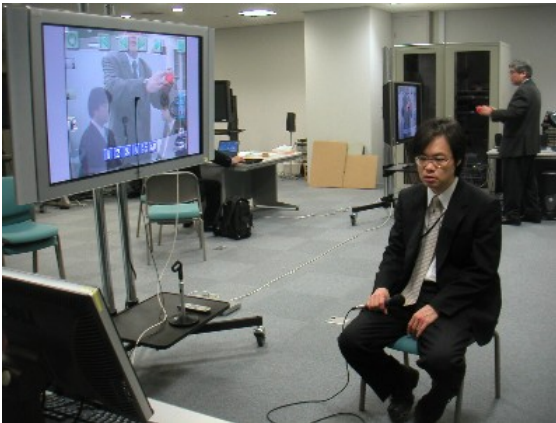
北九州JGN II RC RCでの構築システム(1地点目)