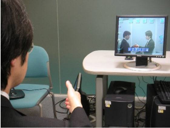
遠隔講義デモの様子(客観視点時) (北九州側ユーザ)