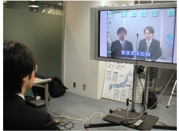
遠隔講義デモの様子(主観視点時) (北九州側ユーザ)