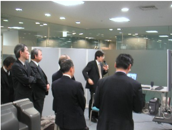
評価委員会でのデモ説明の様子1