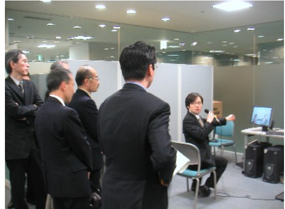
評価委員会でのデモ説明の様子2