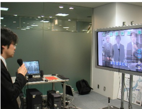
つくばとの3地点接続実験の様子 (北九州側地点)