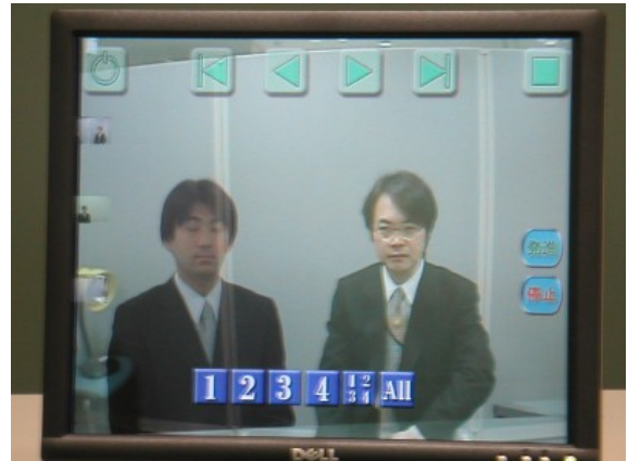
遠隔講義デモの画面(主観視点時) (左ユーザ:つくば、右ユーザ:北九州)