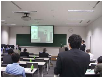
○盛岡会場から秋田会場へ質問