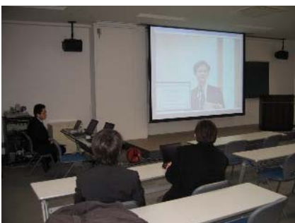
○盛岡会場から秋田会場へ質問