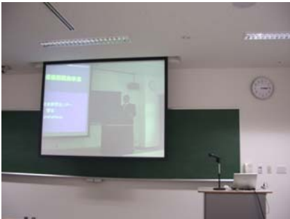
○秋田会場より遠隔講演