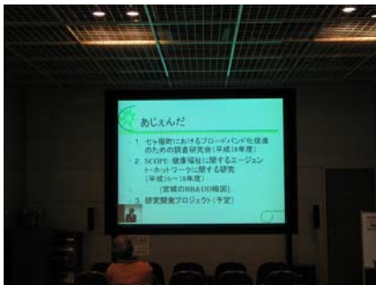
○会津大学での受信状況