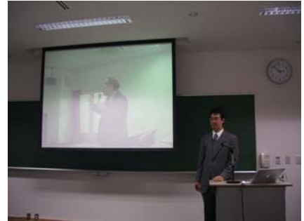
○秋田会場から盛岡会場へ質問