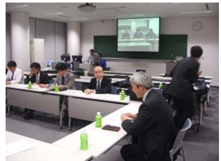
○研究会(秋田会場遠隔会議)