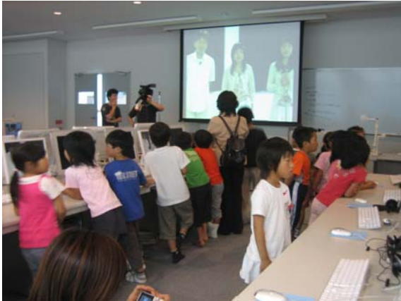
高知工科大学会場の模様