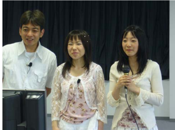
つくば RC 側 (kirakira メンバー)