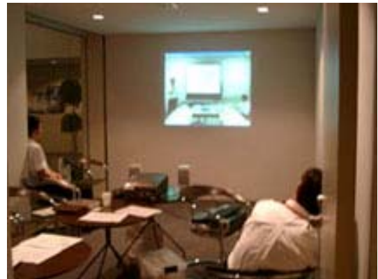
ソフトピアの受信模様