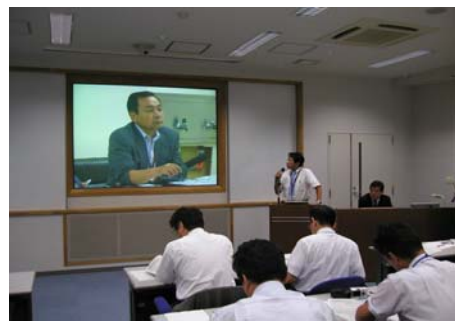
○盛岡：秋田からの質問へ回答