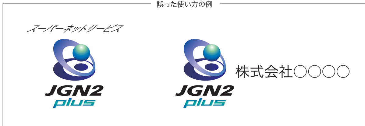
誤った使い方の例

他のマークや商標および製品・団体名称などの文字や記号は、本シンボルマークから十分に離し、両者が一体のものと認識されることの無いようにご注意ください。