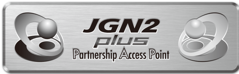
モノクロ(背景メタル)