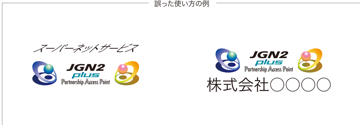
誤った使い方の例

他のマークや商標、あるいは製品や団体名称などを表す文字、記号などと組み合わせてお使いになることは、特定の製品や団体に対して、JGN2plus PAP が個別にサポートしている印象を与える可能性がありますので、おやめください。他のマークや商標および製品・団体名称などの文字や記号は、本シンボルマークから十分に離し、両者が一体のものと認識されることの無いようにご注意ください。