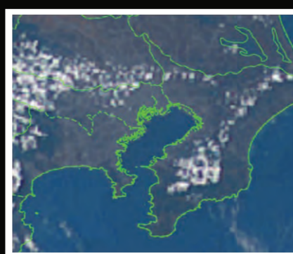
海岸線は黄・緑・赤・なしから選択