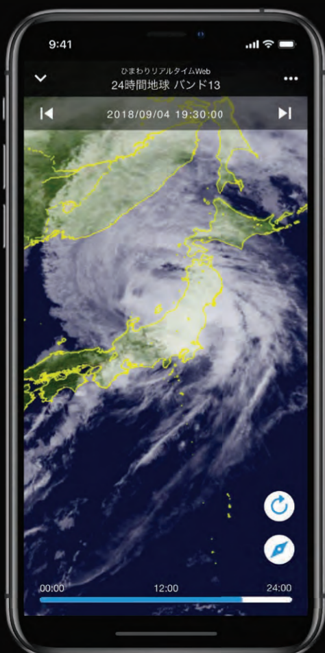
バンド13でみる夜間の地球